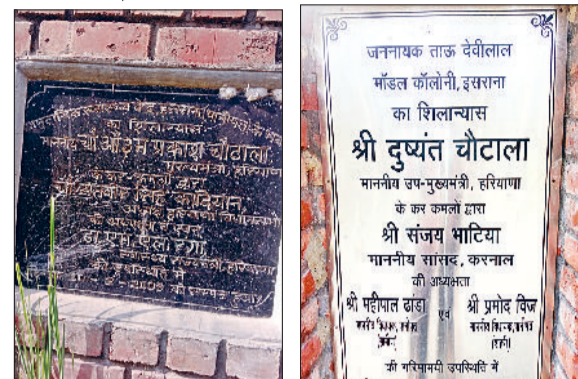
इसराना। ओपी चौटाला द्वारा रखी गई सीएचसी की आधारशिला व डिप्टी सीएम दुष्यंत चौटाला द्वारा रखी गई जन नायक देवीलाल माडन कॉलोनी की आधारशिला।

निर्माण प्रक्रिया के दौरान स्थापित किया गया पहला पत्थर या ईंट जो नींव पर रखी जाती है उसे आधारशिला कहते हैं। विकास कार्यों की आधारशिला विधायक से लेकर मंत्री और मुख्यमंत्री आदि प्रतिनिधियों द्वारा रखी जाती है। जिससे जन-मानस को आने वाले समय में इसका लाभ मिल सके। सरकारी भवन निर्माण किया जा सके। इसराना में दादा पोता द्वारा रखी दो आधारशिला जो मुकदरशक बन जनता के मजाक का कारण बनी हुई हैं। बता दें कि इसराना में पूर्व मुख्यमंत्री ओमप्रकाश चौटाला ने थाना के पास 10 फरवरी 2003 में सीएचसी की आधारशिला रखी थी। 20 साल बीतने के बाद आज भी आधारशिला ही खड़ी हुई नजर आ रही है। सीएचसी के निर्माण कार्य की एक भी ईंट नहीं लगी। जबकि इसराना हल्का वासियों को आज भी आशा है कि कोई तो इसका निर्माण कार्य शुरू