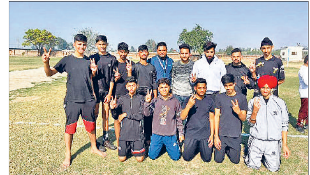
अंबाला। खेलकूद स्पर्धा में मेडल जीतने वाली टीम।

परिवर्तन आया। दैवी प्रेरणा से उन्हें हीरे-जवाहरात का व्यापार कौड़ियों तुल्य लगने लगा। इन्होंने अपनी संपत्ति बेचकर एक ट्रस्ट की स्थापना की तथा माताओं-बहनों को आगे रख इस कारवां का शुभारंभ किया। उन्होंने 1937 में हैदराबाद स्थित ब्रह्माकुमारी संगठन की स्थापना की। अपना मुख्यालय राजस्थान के माउंट आबू में 1953 में स्थानांतरित कर दिया। यह संगठन स्वातंत्र्य परिचरित और विश्व नवीनीकरण के लिए समर्पित एक विश्वव्यापी आध्यात्मिक आंदोलन के रूप में उभरा।